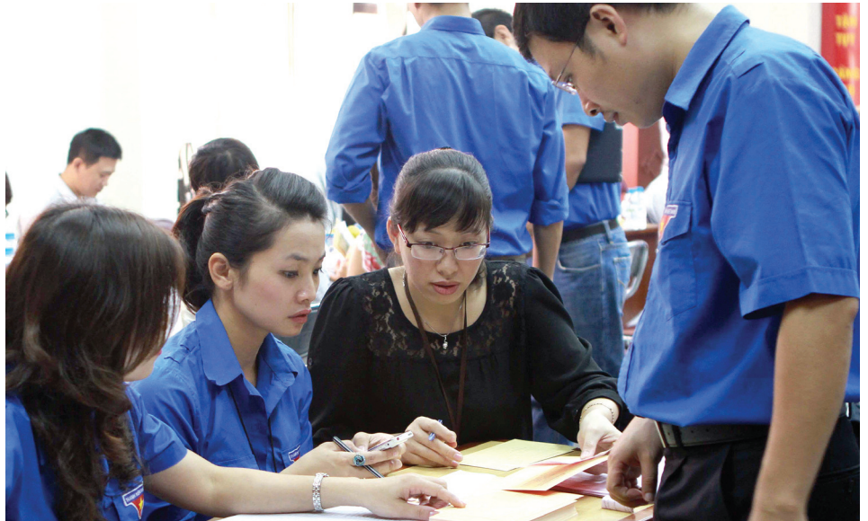
Tiếp nhận đoàn viên tham gia sinh hoạt nơi cư trú

Để giải “bài toán” thiếu hụt lực lượng, nâng cao chất lượng hoạt động Đoàn ở địa bàn dân cư, việc tổ chức cho đoàn viên tham gia sinh hoạt nơi cư trú là chủ trương đúng đắn trong tình hình hiện nay.