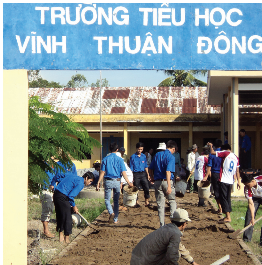
Đoàn viên thanh niên tham gia tu sửa khuôn viên trường học

Theo Huyện đoàn Long Mỹ, tính đến thời điểm này, toàn huyện có 47/94 chi đoàn xây dựng được mô hình “4 nâng, 4 giảm”. Tuy nhiên, vẫn có nhiều chi đoàn