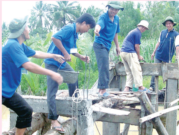
Đoàn viên thanh niên tham gia bê tông hóa cầu nông thôn

Sau gần 30 năm đổi mới, thế và lực của đất nước ta đã lớn mạnh, nhưng bên cạnh những thuận lợi cơ bản, cơ hội và thách thức vẫn đan xen các thế lực thù địch gia tăng thực hiện âm mưu “diễn biến hoà bình”, bạo loạn lật đổ, lợi dụng vấn đề tôn giáo, dân tộc, dân chủ, nhân quyền... để can thiệp vào công việc nội bộ nước ta, chống phá Đảng, Nhà nước và sự nghiệp đổi mới của nhân dân ta. Tình hình đó đòi hỏi toàn Đảng, toàn dân, toàn quân không ngừng mài sắc cảnh giác, phát huy cao độ nội lực; phát huy sức mạnh của khối đại đoàn kết toàn dân tộc mà nòng cốt là liên minh công nhân - nông dân - trí thức dưới sự lãnh đạo của Đảng; giữ vững và tăng cường đoàn kết quân dân, đoàn kết hữu nghị với nhân dân và Quân đội các nước theo truyền thống của Đảng, của dân tộc và