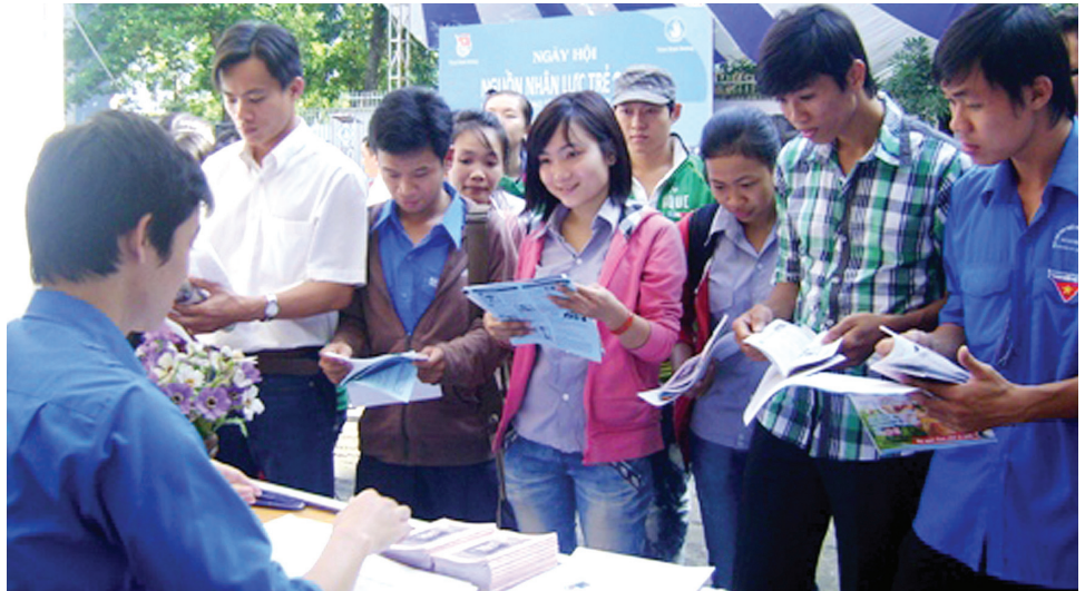
Tư vấn, hướng nghiệp cho thanh niên

Theo thống kê đến cuối năm 2013, Quảng Bình có 34.746 đoàn viên trên địa bàn nông thôn, trong đó số đoàn viên đi làm ăn xa chiếm 47,4%. Trước tác động của nền kinh tế thị trường, công tác thu hút, tập hợp, đoàn kết thanh niên nông thôn đang là bài toán đặt ra đối với tổ chức Đoàn.