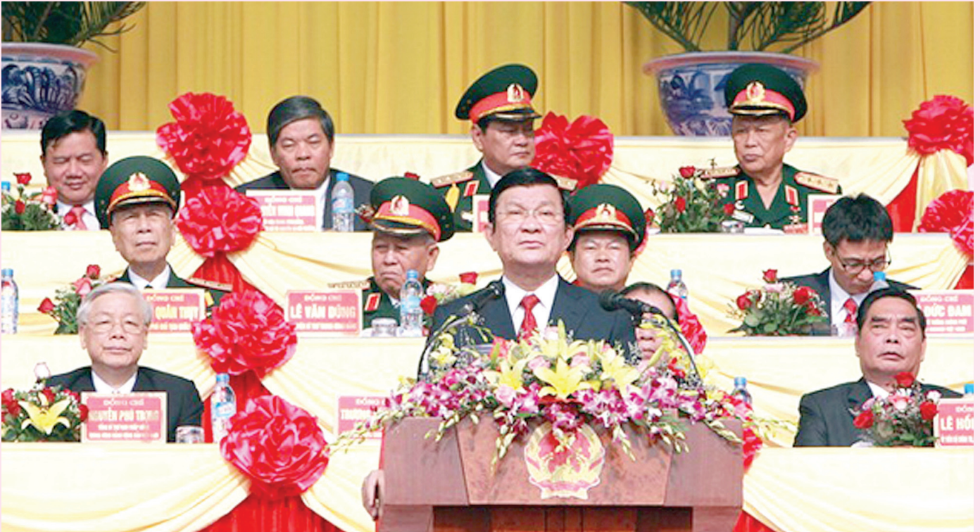
Chủ tịch nước Trương Tấn Sang phát biểu tại Lễ kỷ niệm